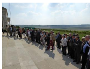
Dépôt de gerbe