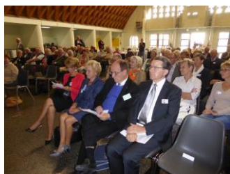
Le rang des officiels