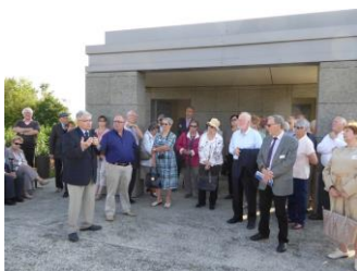
Un peu d'histoire sur la bataille de Le Hamel

Nous fûmes ensuite reçus par la municipalité pour une collation ANZAC.