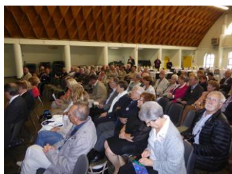
Les participants à la Journée

Le Président national, après avoir remercié les personnalités et toute l'assistance, insista sur les objectifs généraux de l'AMOPA – très attaché au « Label-Qualité », il précisa qu'un document en cours d'élaboration sera co-signé, en ce sens, avec le Ministère de l'Education Nationale. Il rappela que les 3 sections de Picardie furent les premières à réaliser ce vœu de mutualisation des actions au niveau de la Région. Ainsi qu'en ce jour de rencontre, il souhaite que se perpétuent « des liens durables, des partages opérationnels », par des expositions, des conférences, dans le « souvenir, l'émotion, la fraternité » des combattants pour « la cause humaine » (sic), l'AMOPA prônant les rapprochements au-delà des différences.