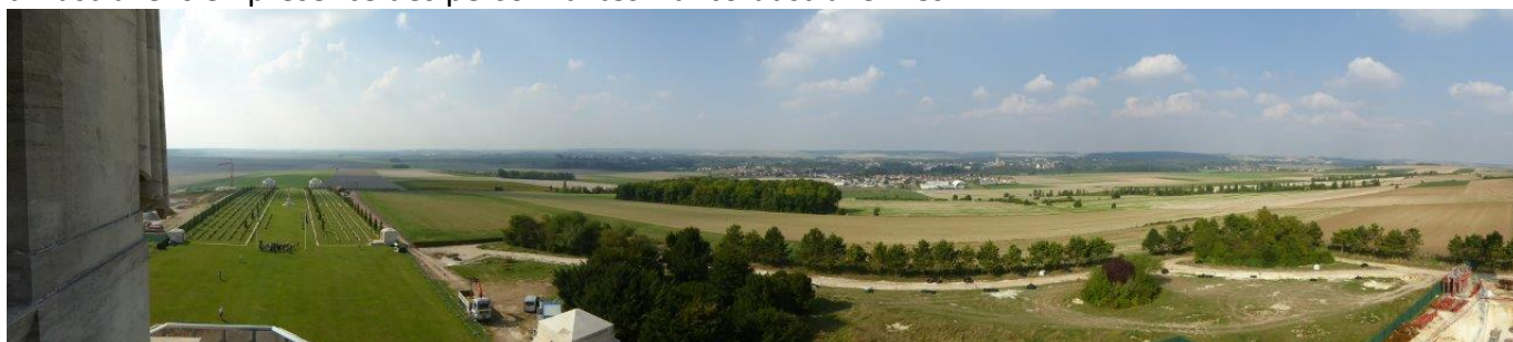
Le Mémorial de Villers-Bretonneux se situe à même le champ de bataille et domine la plaine jusqu'à l'horizon, jusqu'à Amiens.

Le 25 avril de chaque année, dès l'aube à 5h30, est célébré l'ANZAC-DAY rassemblant des milliers d'Australiens en présence des personnalités franco-australiennes.