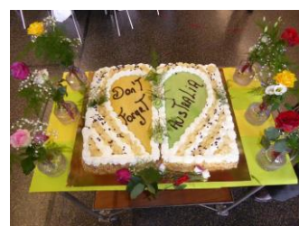
Jusque sur le gâteau !