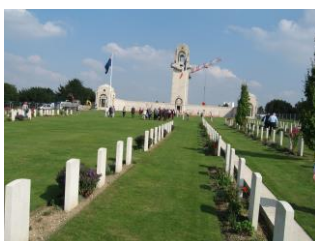
Le Mémorial de Villers-Bretonneux (PL)