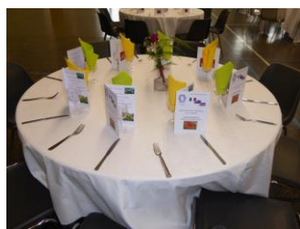
Le vert et le jaune sur les tables