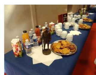
Les ANZAC biscuits (BG)