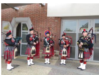
Les bag-pipers « The Jocks and Drums »