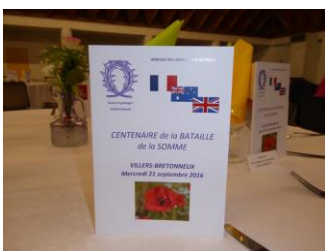
Le menu australien