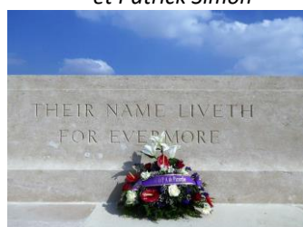
Dépôt de gerbe par l'AMOPA