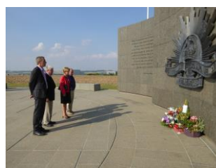
Le dépôt de gerbe