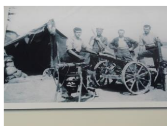
Position stratégique australienne à Le Hamel (BG)