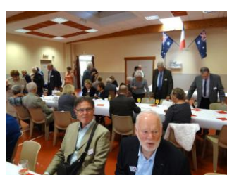
Collation ANZAC à Le Hamel (BG)