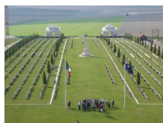
Le cimetière australien vu du haut du Mémorial