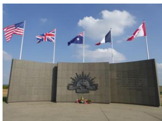
Le Mémorial de Le Hamel... .. sur le champ de bataille (PhS)

Par la route de la crête du front, nous poursuivîmes vers Le Hamel où se déroula une bataille acharnée le 4 juillet 1918, qui enleva définitivement cette terrible position allemande de la côte 104 à Villers-Bretonneux.